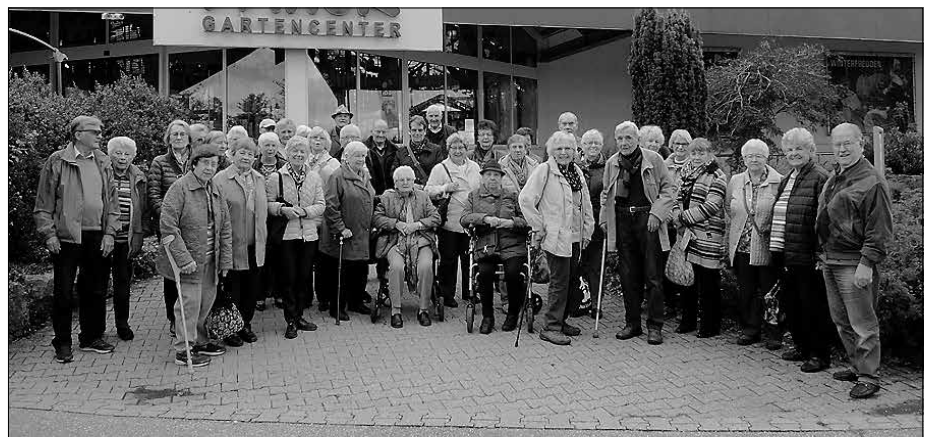
Der Seniorentreff Künzelsau nach Ankunft am Reiseziel „Pflanzen Mauk“ in Lauffen am Neckar.

Baden-Württembergs größtes Erlebnis-Gartencenter, Pflanzen Mauk in Lauffen am Neckar, war das Ziel für 36 Teilnehmer des Seniorentreffs Künzelsau. Durchs herbstlich gefärbte Kochertal ging es über Neuenstadt nach Lauffen. Diese 3. Halbtagsfahrt 2019 des Vereins war für viele eine willkommene Einkaufstour, hinsichtlich der kommenden Weihnachtszeit. Aber natürlich nicht nur das - denn es ist wirklich ein Erlebnis das riesige Angebot an Pflanzen im Gartenpark und in den Gewächshäusern zu bestaunen. Besonderes Interesse fand natürlich der festlich geschmückte Weihnachtsmarkt, mit einer Vielzahl an Keramik und stilvollen Dekorationen - ein riesiges Angebot, das Seinesgleichen sucht. Dies war auch die Grundidee für die Fahrt: Alle konnten bei einem Aufenthalt von mehr als drei Stunden nach Herzenslust ohne Eile stöbern. Im haus-