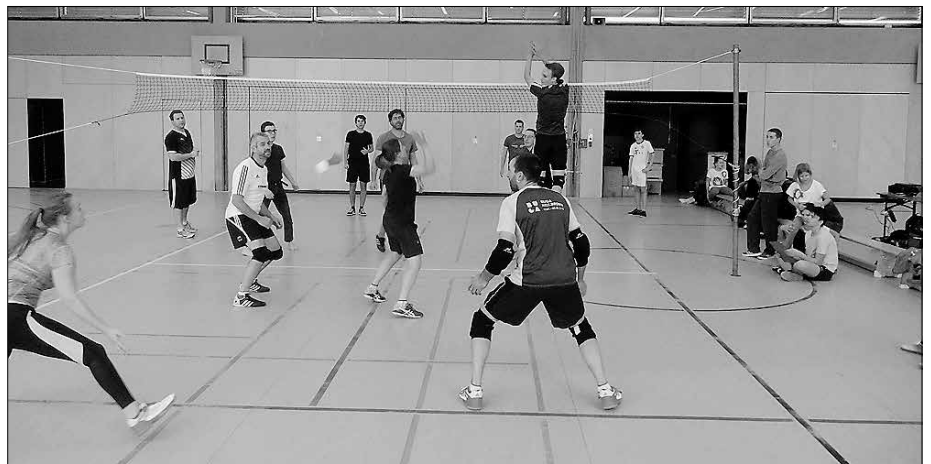
Beim Indiac-Turnier 2019 war sehr viel Engagement, Freude und vor allem Potential zu sehen.

Wenn im November draußen das Wetter kalt und trüb wird, verlagern sich auch die Aktivitäten mehr nach drinnen. So auch das Hohenloher Indiac-Turnier 2019 welches am 10. November in der Sporthalle der Georg-Wagner-Schule am Fluss stattfand. Ob es am Wetter lag und damit an den möglicherweise fehlenden Vorbereitungen – es fanden sich gerade mal fünf Teams ein – um die Titel in den Kategorien „Jungchar“, „Jugend“ und „Senioren“ auszuspüren. Das „Mädchen-Café Künzelsau“ hatte es am Einfachsten: Als einziges Team der Kategorie „Jungchar“ hatten sie bereits den Pokal sicher, ohne auch nur eine Indiac berührt zu haben. In den anderen beiden Kategorien war es immerhin jeweils ein Zweikampf. Jeder gegen jeden – in Vor- und Rückrunde. Durch die geringe Anzahl der Teams konnte das Turnier in dieser außergewöhnlichen Form ausgespielt werden. Schnell wurde klar, dass dabei das Team „Mischkappen